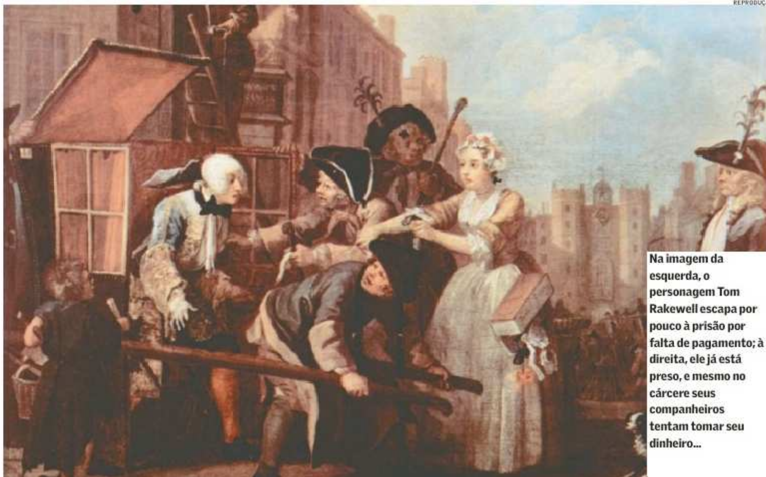
Na imagem da esquerda, o personagem Tom Rakewell escapa por pouco à prisão por falta de pagamento; à direita, ele já está preso, e mesmo no cárcere seus companheiros tentam tomar seu dinheiro...