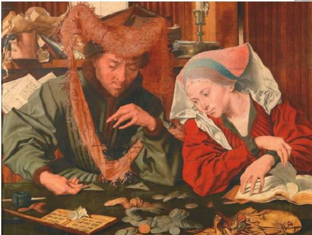
Na versão de Marinus van Reymerswaele para "O Banqueiro e sua Mulher" (1539), a representação do financista é positiva