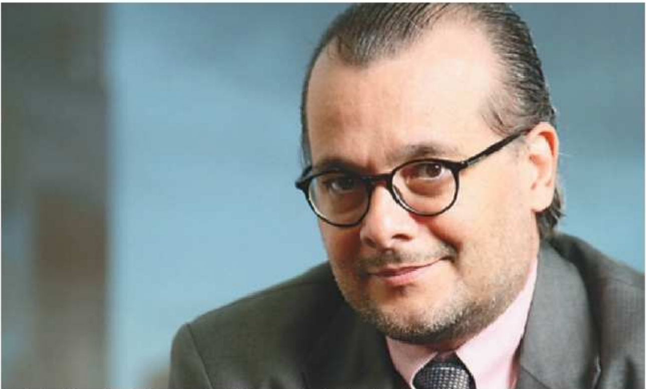
Para Gustavo Franco, Goethe põe em questão a ideia de que os investimentos de Fausto sejam diabólicos: ao fim, o personagem é salvo