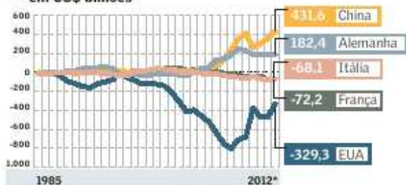
Balanco de Pagamentos - Saldo anual em transações correntes - em US$ bilhões