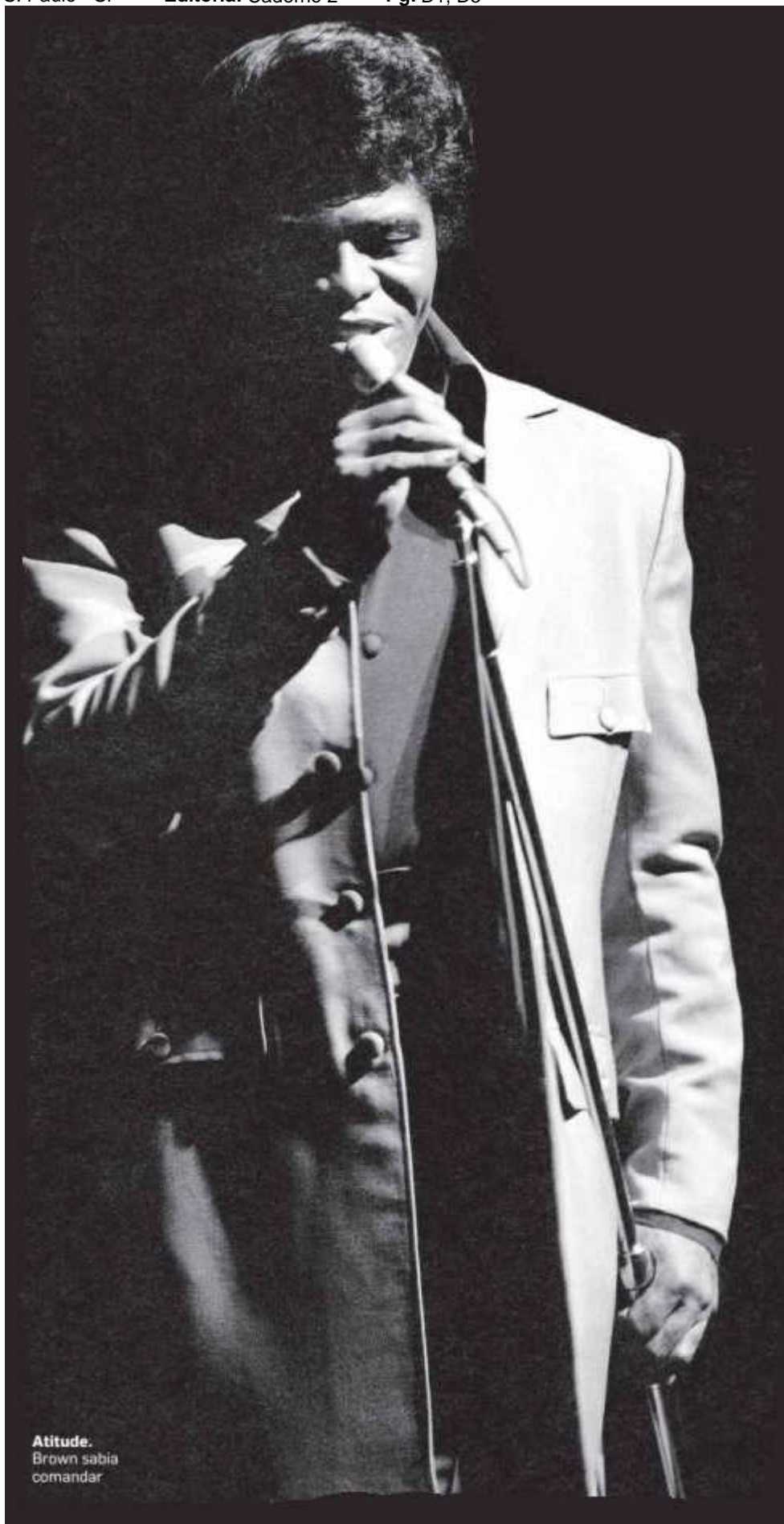
Atitude. Brown sabia comandar