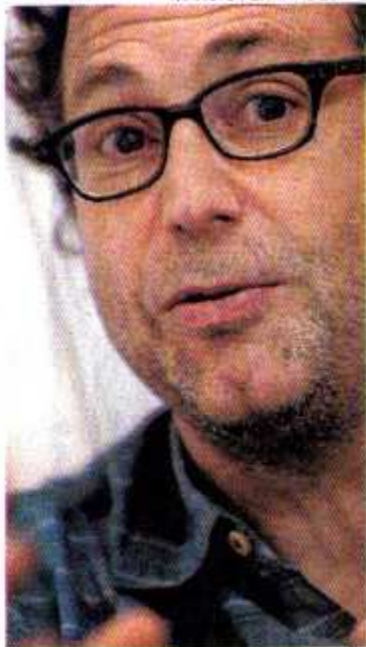
MLODINOW - Exemplos divertidos

Mlodinow também refaz a pouco conhecida história de todos aqueles pensadores que lidaram com a incerteza. E não é uma história fácil de reconstruir, porque, afinal, muitos dos seus especialistas foram pessoas mais preocupadas com magia e apostas, do que com livros e raciocínios abstratos. Mas o leitor pode familiarizar-se com